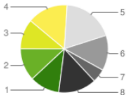
1 - Mūsų vaikas mokosi